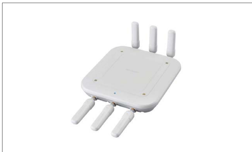
シャープ Wi-Fiアクセスポイント