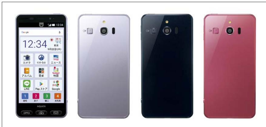
シャープ ソフトバンク株式会社向け「シンプルスマホ3」 (左からライラックシルバー、ブラック、ピンク)

(開発中の端末であり、仕様が変更される場合があります。特長の詳細については、後日当社ウェブサイトにてご案内いたします。)