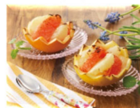
フルーツグリル (グレープフルーツ)