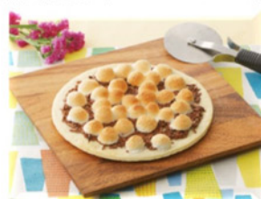
スイーツグリル (マシュマロピザ)