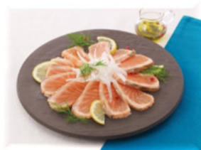
サーモンのたたき