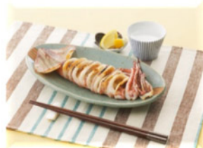
海鮮焼き(いかのあぶり)