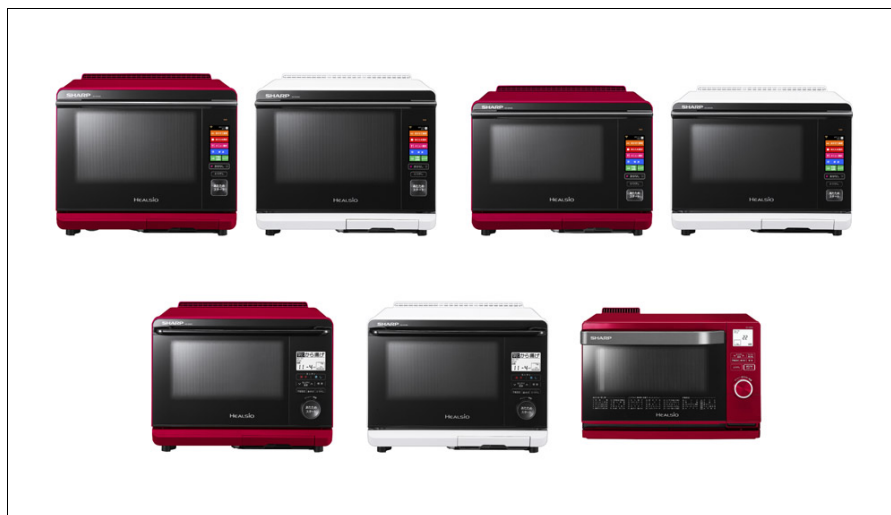
シャープ ウォーターオープン ヘルシオ

上段 左から <AX-XW400-R(レッド系)><AX-XW400-W(ホワイト系)><AX-AW400-R(レッド系)><AX-AW400-W(ホワイト系)> 下段 左から <AX-AS400-R(レッド系)><AX-AS400-W(ホワイト系)><AX-CA400-R(レッド系)>