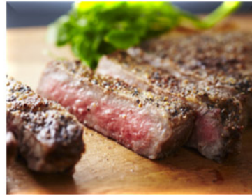
あぶり厚切りビーフステーキ