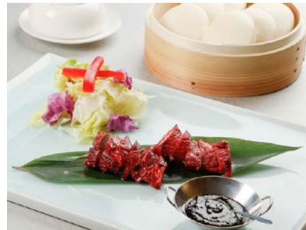
ハニーペッパーの叉焼サンド