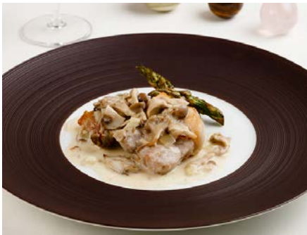
もち豚ロース肉とたっぷりキノコのフリカッセ