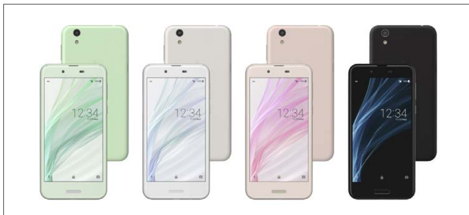
シャープ KDDI株式会社向け <AQUOS sense SHV40> (左から、オパールグリーン、シルキーホワイト、ミスティピンク、ベルベットブラック)

(開発中の端末であり、仕様が変わる場合があります。特長の詳細については、後日当社ウェブサイトにてご案内いたします。)