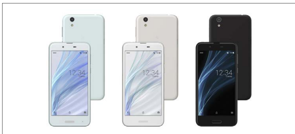
シャープ UQ mobile向け <AQUOS sense> (左から、エアリーブルー、シルキーホワイト、ベルベットブラック)

(開発中の端末であり、仕様が変わる場合があります。特長の詳細については、後日当社ウェブサイトにてご案内いたします。)