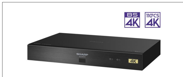
シャープ 4Kチューナー <4S-C00AS1>