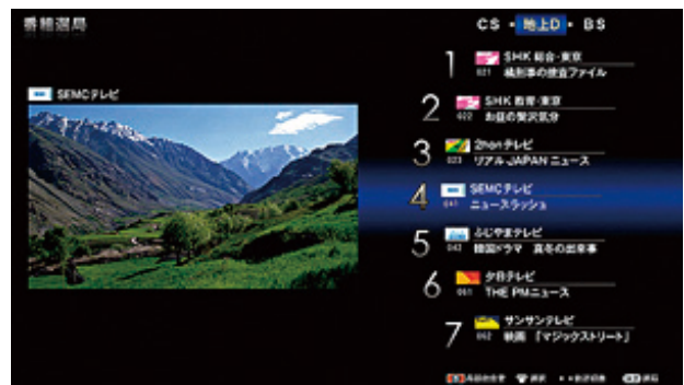
図5 ユーザインタフェース