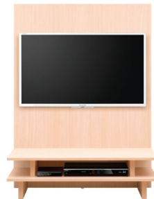
壁寄せ設置 (オプション)