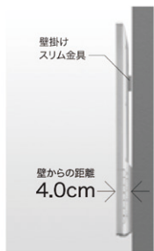
壁掛けスリム設置