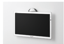
壁掛けフック設置 (オプション)