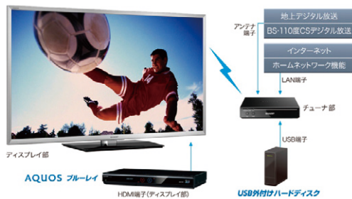
図2 多彩な設置スタイル