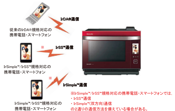
図3 赤外線通信方式の自動認識