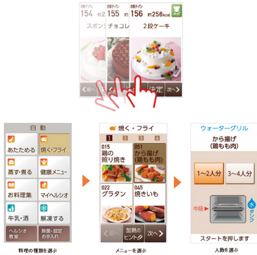
図1 ヘルシオタッチパネル

○指でなぞる、ボタンをタッチするなどの簡単操作によって、メニューの選択などが簡単に楽しく選べる。