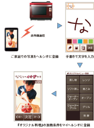
図2 「マイヘルシオ」機能

○新しく加わった「マイヘルシオ」。作った料理写真を携帯電話やスマートフォンから赤外線通信機能でヘルシオに送信。メニュー名や加熱条件とともに、オリジナルメニューとしてヘルシオに登録可能。