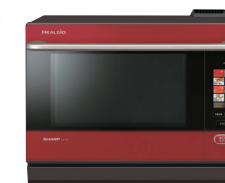
ウォーターオープンヘルシオ AX-SP1-R オープン価格

2004年の発売以来、ヘルシオは最初から最後まで“水で焼く”独自の技術で、脱油・減塩・栄養素の保持など健康効果を追求し、お客様の食生活をサポートしてまいりました。2013年発売の機種からは、糖尿病、高血圧、腎臓病などで食事を制限されている方にお勧めする、ヘルシオで手軽に調理できる疾病別レシピを開発、提供しています。