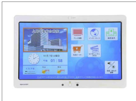
<上尾中央総合病院 入院病棟内>