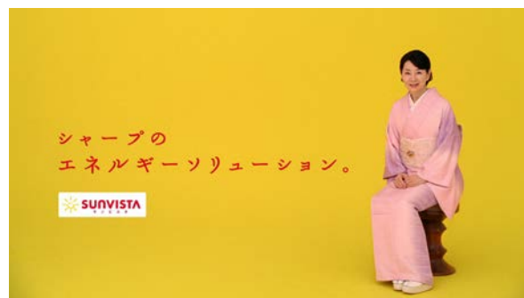
テレビコマーシャル「シャープのソーラーエネルギーソリューション。」篇