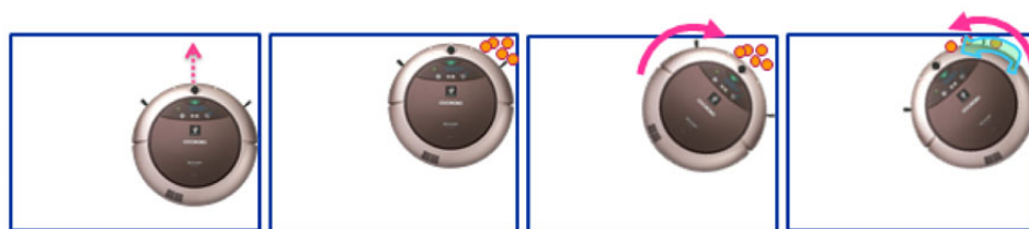
①壁際・家具際を走行 ②超音波センサーで隅検知！ ③左右に首振り走行しながら、強く風を吹き付ける！