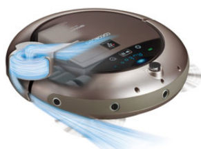
エアーすみブラシ イメージ

本体右側面から風を吹き付けてごみをかきだす「エアーすみブラシ」を開発。超音波センサーで部屋の隅を検知すると、自動で本体側面から隅に向かって風を強く吹き付け左右に「首振り」走行し、今までとれにくかった部屋の隅のごみをかきだします。かきだしたごみを、左右二つのサイドブラシと床にやさしい素材の回転ブラシ・大風量ターボファンが、集めて吸い込みます。これにより、部屋の隅のごみを当社従来機種比 ※2 約2.6倍まで除去 ※3 します。