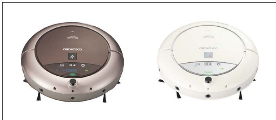
シャープ ロボット家電「COCOROBO」 <RX-V95A><RX-V70A>