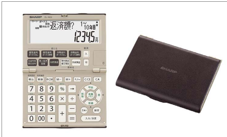
シャープ 金融電卓 <EL-K632>