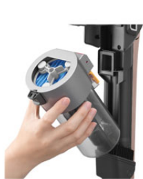
ごみ捨てはカップを 本体から外して