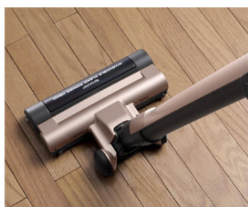
フローリングのしつこい汚れも拭き掃除 <EC-SX310>

<EC-SX310>は、前から横からも吸引する吸込口との相乗効果で、部屋の壁際や隅にたまりやすい綿ボコリなどのごみを強力に引き込みます。また、4種類のファイバー素材を採用した「床みがきブラシ」により、フローリング表面のしつこい汚れなども拭きとります。