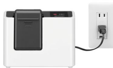
専用充電器でバッテリーを高速充電