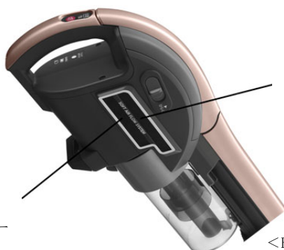
アレル物質を抑制する ※12 Ag + アレルディフェンスフィルター

さらに<EC-SX310>は、アレル物質を抑制 ※12 するAg + アレルディフェンスフィルターと、掃除中に顔や体にあたると不快な排気風を弱めて放出するメッシュ状の排気口を採用しています。