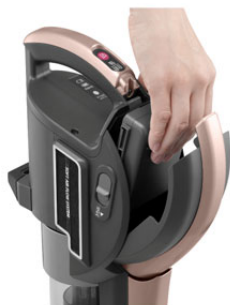
バッテリーが簡単に取り外せる