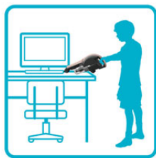
テーブル・ デスクの上に

パイプを外し付属品の「ベンリブラシ」をセットすると、パソコンのキーボードなど凹凸のある場所なども簡単に掃除できるほか、「すき間ノズル」を使えば、すき間など狭い場所の掃除ができます。また、これらのアタッチメントをパイプの先につければ、高い場所の掃除も可能です。