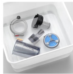
カップもフィルターも まるごと水洗いOK

さらに、<EC-SX310>はダストカップやフィルターだけでなく吸込口の汚れやすい部分 ※13 も水洗いができるので、吸込口内部に溜まったハウスダストや細かい食べこぼしなどもきれいに洗い落とし、吸込口を清潔に保つことができます。