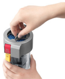
フィルターのお手入れは、 つまみをクルクルまわすだけ