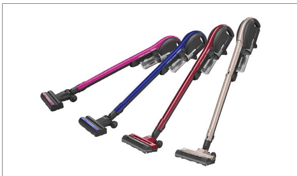
シャープ コードレスサイクロン掃除機

右から、<EC-SX310-N(ゴールド系)><EC-SX310-R(レッド系)> <EC-SX210-A(ブルー系)><EC-SX210-P(ピンク系)>