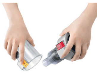
ワンタッチで 捨てるだけ