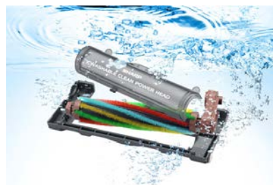
吸込口の汚れやすい部分 ※13 は簡単に外せて水洗いOK

さらに、<EC-SX310>はダストカップやフィルターだけでなく吸込口の汚れやすい部分 ※13 も水洗いができるので、吸込口内部に溜まったハウスダストや細かい食べこぼしなどもきれいに洗い落とし、吸込口を清潔に保つことができます。