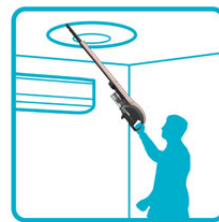
照明やエアコンなどの 高い所に

さらに<EC-SX310>は付属の「2WAYベンリヘッド」を使用すると、布を吸い込まずにホコリなどを吸引できるので、ソファや布団、カーテンの掃除に便利です。