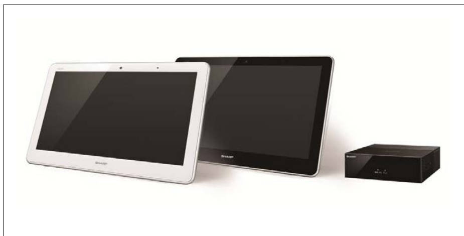
シャープ テレビ機能付ホームタブレット “AQUOS ファミレド” <HC-16TT1>

※7 本機はデータ放送には対応していません。本機のアンテナ端子は、地上デジタル/BS/CSデジタルの混合1系統です。ご家庭のアンテナ端子が地上デジタルとBS/CSデジタルで分かれている場合は、別途混合器をお買い求めください。チューナー部のアンテナ端子は、BS/CSアンテナへの電源供給を行っておりません。市販の電源供給器などをご利用ください。