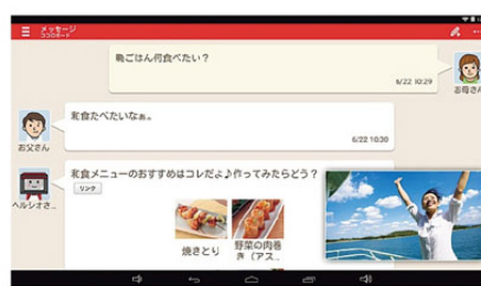
テレビ表示したまま、アプリやネットを楽しめる