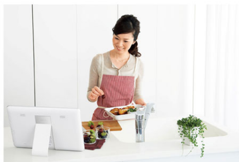
スタンド付きなので、キッチンでも無理なく視聴が可能

本体付属のスタンドを立ててキッチンカウンターに置いて料理をしたり、平置きにして親子でゲームをしたり、シーンに応じて自由な使い方が楽しめます。