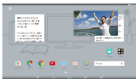
テレビ画面を長押しすれば、画面の移動が可能