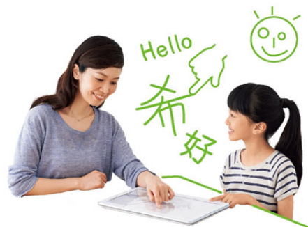
子供と一緒に楽しく学べる知育アプリも充実