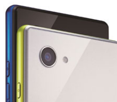
●コンパクト設計とバイカラーデザインの本体