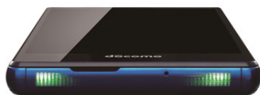
●9色のカラーと、12パターンの光り方で多彩に演出する「ヒカリエモーション」