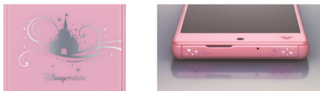
ディズニーの世界観を演出する背面デザインとイルミネーション © Disney