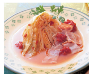
キャベツの丸ごとスープ煮