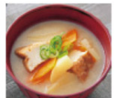
具だくさんみそ汁