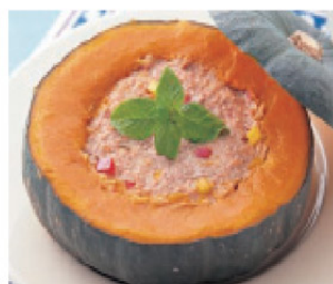
かぼちゃの肉詰め