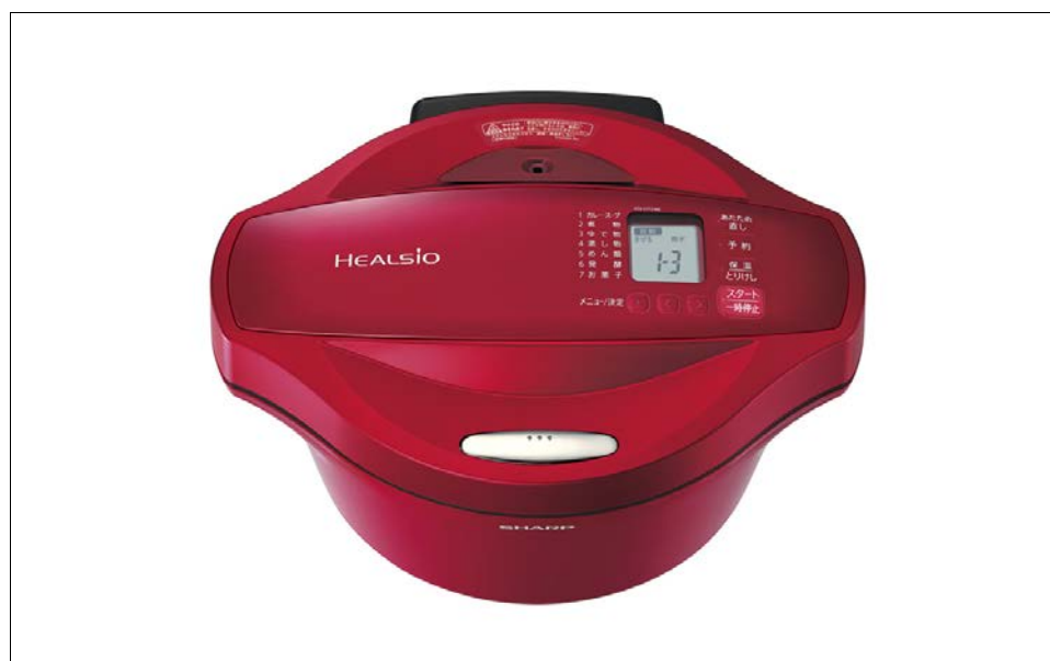
シャープ 水なし自動調理鍋「ヘルシオ ホットクック」 <KN-HT24B-R>