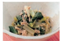
小松菜とツナの煮物