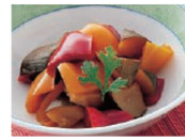
パプリカと ズッキーニのあえ物