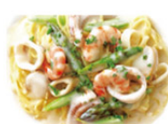
シーフードの クリームパスタ