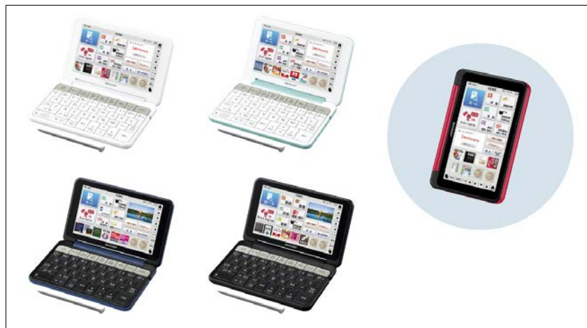
シャープ カラー電子辞書 「Brain (ブレイン)」

左上：高校生向け<PW-SH4-W(ホワイト系)> 右上：中学生向け<PW-SJ4-G(グリーン系)>