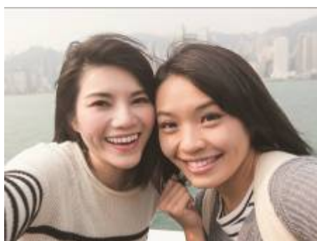
当社従来機種 SHV33 5M画角(約83度)