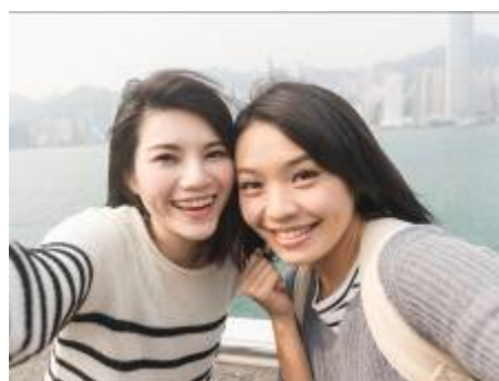
広角インカメラ 8M画角(約100度)