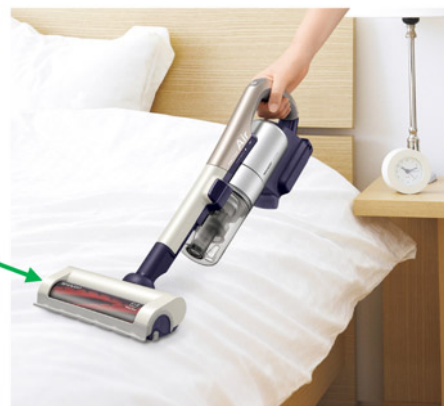
約1.4kgの軽量ボディでふとんに付着した花粉やハウスダストを軽々キャッチ！