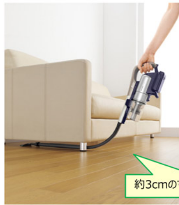
(ヨコスタイル) 家具の下などの狭いすき間の掃除に