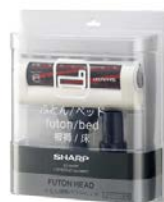
ふとん掃除パワーヘッド <EC-H01FP>

「ふとん掃除パワーヘッド」と「タテヨコ曲がるすき間ノズル」は、当社コードレス掃除機用の別売品として発売いたします。