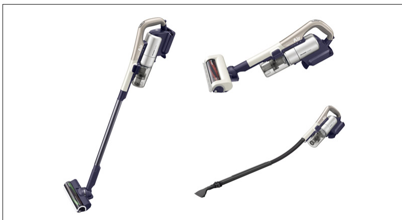
シャープ コードレスサイクロン掃除機「ラクティブ エア」 <EC-A1RX-N(ゴールド系)>

※6 適用機種については、当社ウェブサイトをご確認ください。(http://www.sharp.co.jp/support/cleaner/option/)