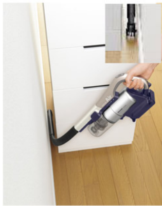
(タテスタイル) 家具と壁との狭いすき間の掃除に