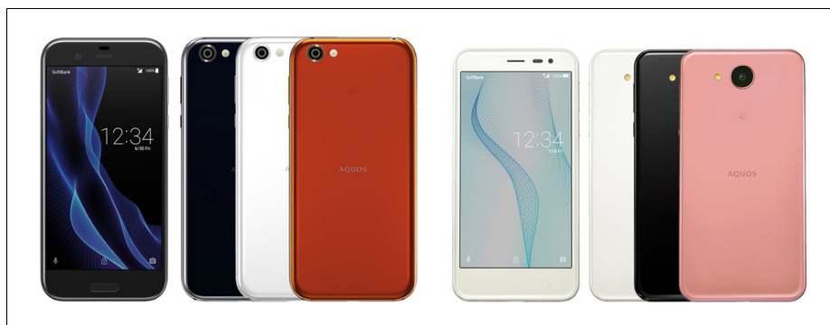
シャープ ソフトバンク株式会社向け 2017年夏モデル 2機種 左から <AQUOS R>(マーキュリーブラック、ジルコニアホワイト、ブレイズオレンジ) <AQUOS ea>(ホワイト、ブラック、ピンク)

(いずれも開発中の端末であり、仕様が変わる場合があります。特長の詳細については、後日当社ウェブサイトにてご案内いたします。)