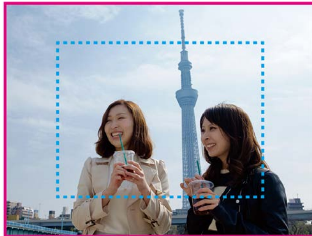
■ ■ ■ 当社従来機種 AQUOS Xx3 ■ AQUOS R