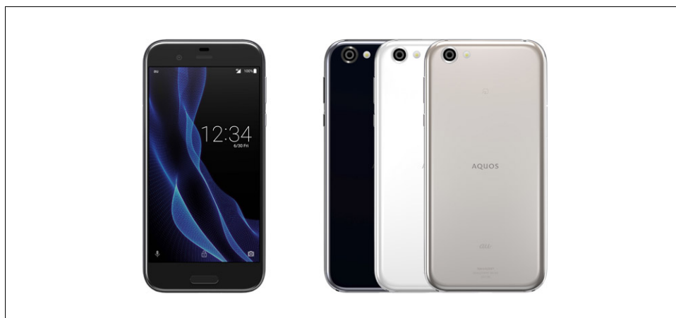
シャープ KDDI株式会社向け <AQUOS R SHV39> (左から、マーキュリーブラック、ジルコニアホワイト、ライトゴールド)

(開発中の端末であり、仕様が変更場合があります。特長の詳細については、後日当社ウェブサイトにてご案内いたします。)