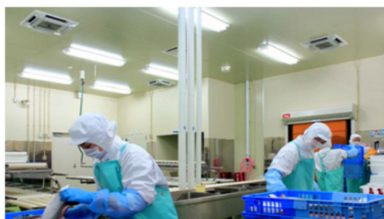
＜食品工場＞ 株式会社ヤマホンベイフーズ様