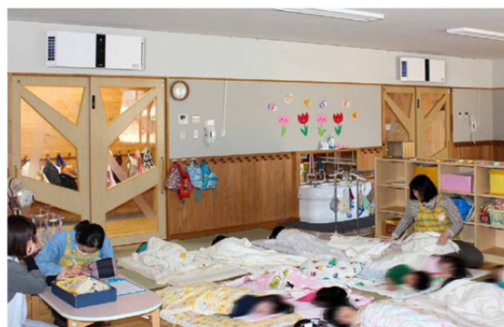
＜幼稚園＞ 学校法人金鶏有明学園 認定こども園 あそびの森有明幼稚園様