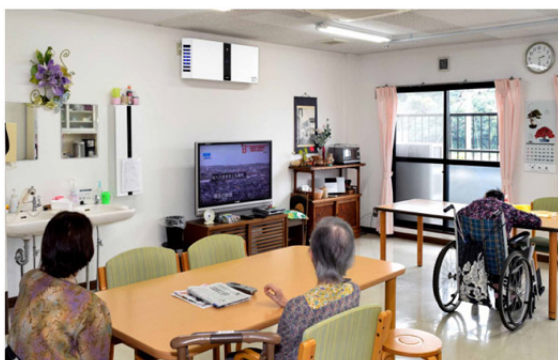
＜介護施設＞ 株式会社サンブレラ様