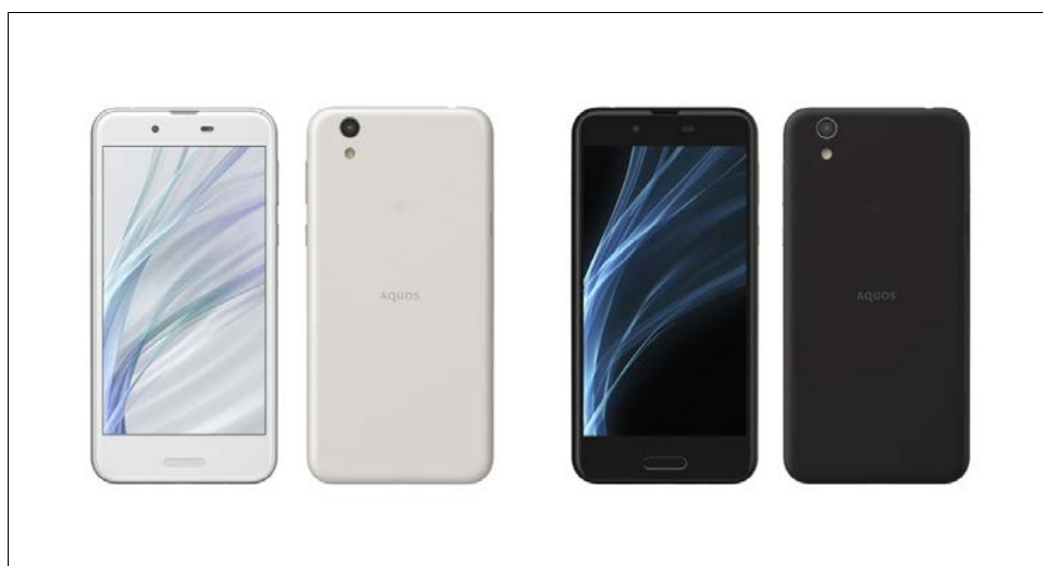
シャープ スマートフォン2017年冬モデル「AQUOS sense」 (左から、シルキーホワイト、ベルベットブラック)

シャープは、スマートフォン市場におけるニーズの拡がりを受け、新シリーズとして「AQUOS sense」を製品化し、スタンダードラインのシリーズ名称を、2017年冬モデルより「AQUOS sense」として展開します。本シリーズは、高精細で色鮮やかな「フルHD IGZO液晶ディスプレイ※ 1 」を搭載、磨き抜かれた基本性能によって安心して使えるスマートフォンを提供します。