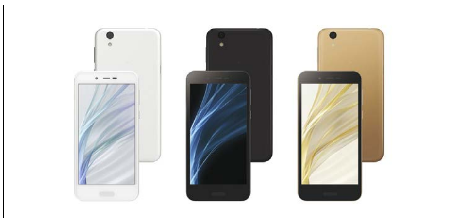
シャープ SIMフリース마트フォン <AQUOS sense lite SH-M05> (左から、White、Black、Gold)

(開発中の端末であり、仕様が変わる場合があります。特長の詳細については、後日当社ウェブサイトにてご案内いたします。)