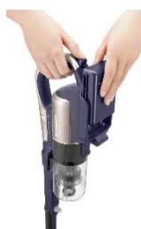
<着脱式バッテリー>