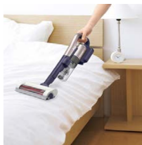
<ふとん掃除パワーヘッド>