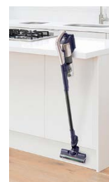
<ちょいかけフック>