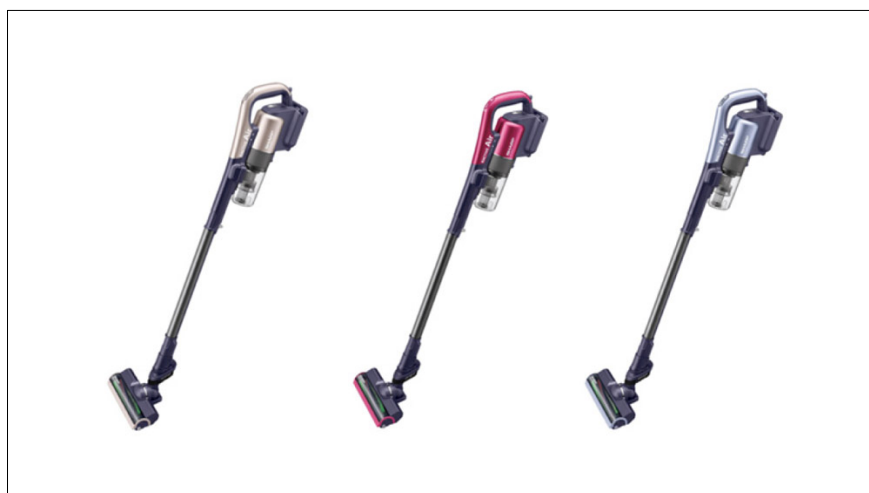
シャープ コードレススティック掃除機「ラクティブ エア」 左から、<EC-AR2SX-N(ゴールド系)>、<EC-AR2S-P(ピンク系)>、<EC-AR2S-V(バイオレット系)>