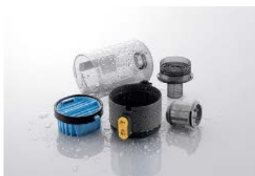
<水洗いできるダストカップ、フィルター>