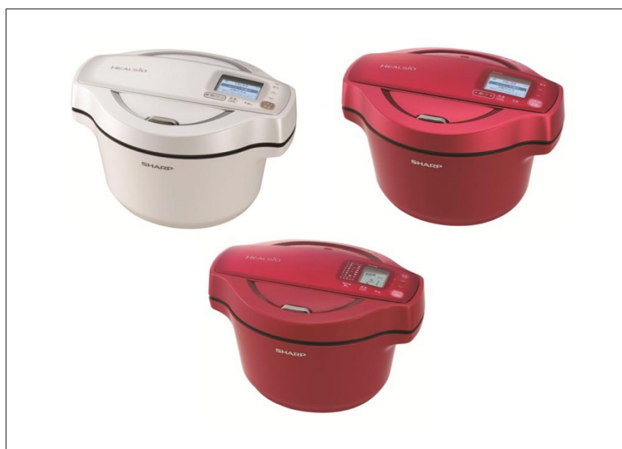
シャープ 水なし自動調理鍋「ヘルシオ ホットクック」 上段<KN-HW16D- W(ホワイト系) /-R(レッド系)> 下段<KN-HT99B-R(レッド系)>