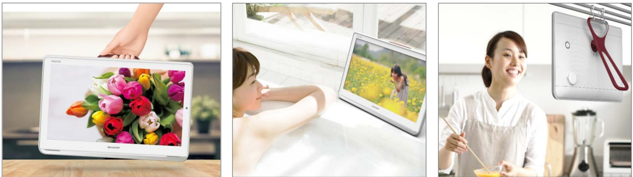
見たい時に家中の好きな場所で手軽に楽しめる