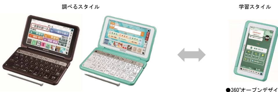
●360°オープンデザイン