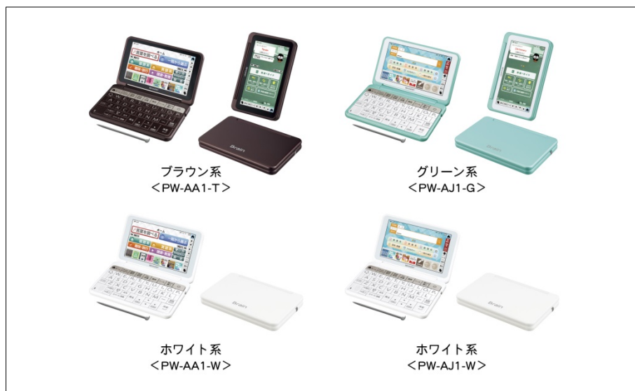
シャープ カラー電子辞書 “Brain (ブレイン)”