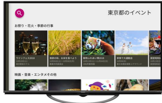
おすすめイベント画面