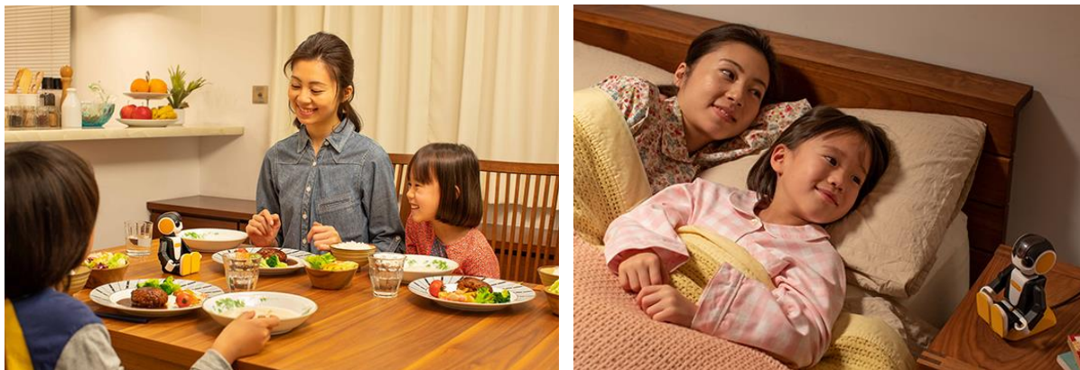
“着座”タイプ『RoBoHoN lite』<SR-05M-Y>の使用シーン

二足歩行が可能な<SR-03M-Y(LTE/3Gモデル)>と<SR-04M-Y(Wi-Fi®モデル)>に加え、今回新たに“着座”タイプの『RoBoHoN lite』<SR-05M-Y(Wi-Fi®モデル)>をラインアップに追加しました。二足歩行などの脚を使った機能を除き、<SR-04M-Y(Wi-Fi®モデル)>に搭載の機能やアプリケーションがそのままお使いいただけます。