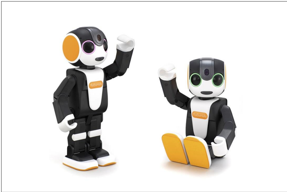
シャープ モバイル型ロボット “RoBoHoN” <左：SR-03M-Y/SR-04M-Y、右：SR-05M-Y>