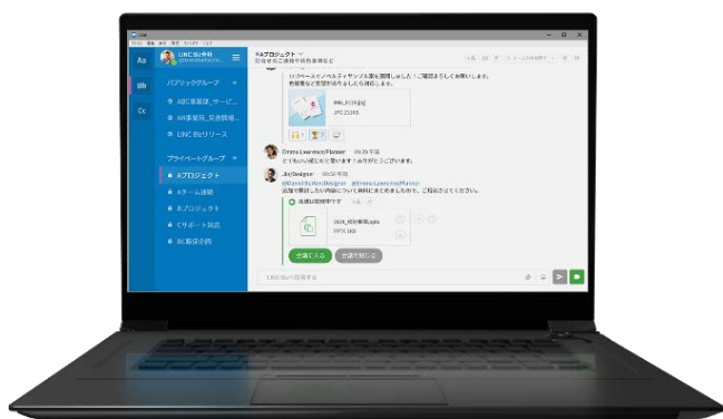
PCでの表示イメージ