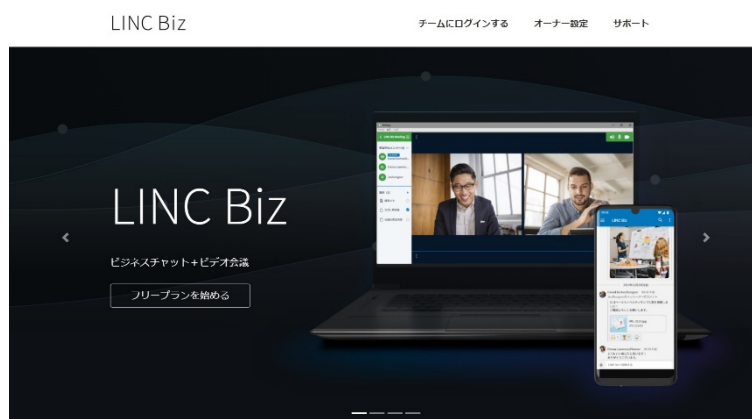
LINC Biz 公式サイト( https://getlincbiz.jp )

シャープの子会社である株式会社AIoTクラウドは、独自のAIoTプラットフォームを活用したクラウドソリューションサービスの第1弾として、ビジネスチャット、音声／ビデオ会議機能を搭載し、2つの機能をシームレスに利用できるビジネスコミュニケーションサービス『LINC Biz』の提供を開始します。