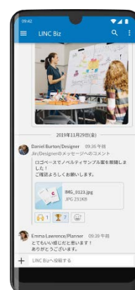
スマートフォンでの表示イメージ