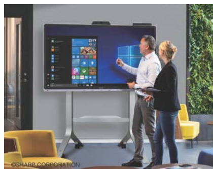
タッチディスプレイ<PN-CD701>

●画面はいずれもハメコミ合成です。右はフロアスタンド<PN-ZS703A>(別売)装着時のイメージです。