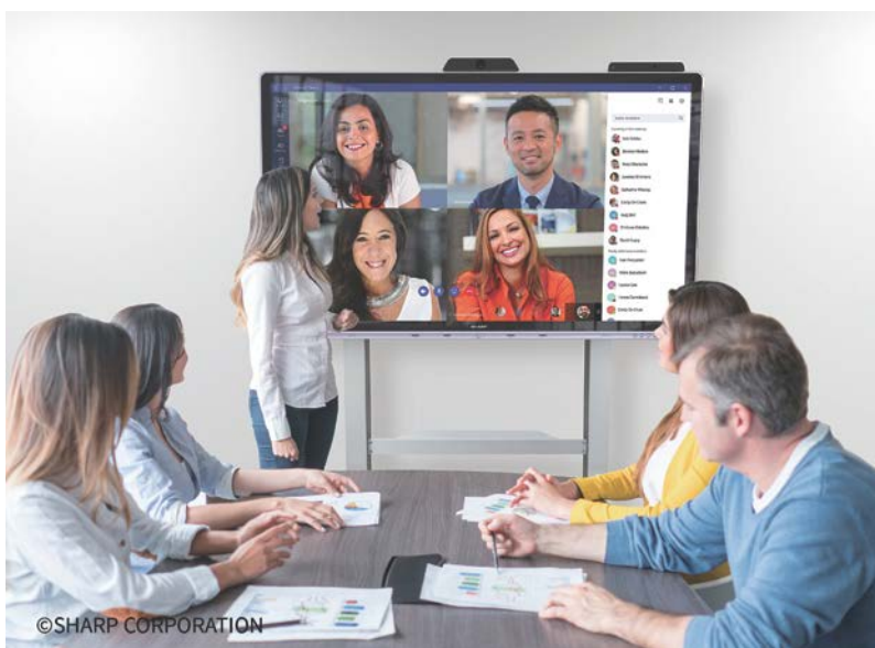
『Microsoft Teams』によるテレビ会議シーン(イメージ)