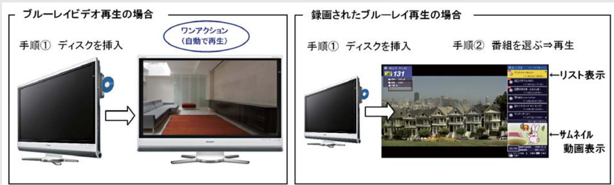
図2 新スタイル「モーションガイド」