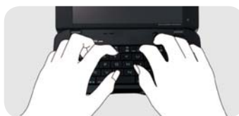
置いてタイピング