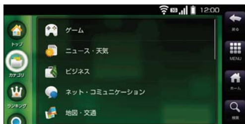
「au one Market」