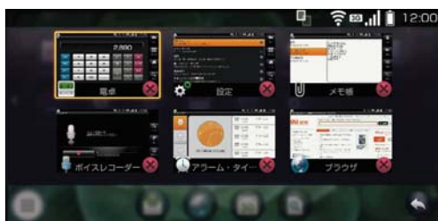
起動中のアプリケーション

Google社が提供する、Android向けに開発されたアプリケーションを集めた「Androidマーケット™」に加え、KDDIが独自に開設する「au one Market」に対応。「ゲーム」「ニュース」「エンターテインメント」などの様々なカテゴリーから、お好みのアプリケーションをダウンロードし、端末を自由にカスタマイズできます。