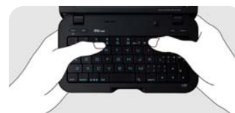
両手で持って親指タイピング