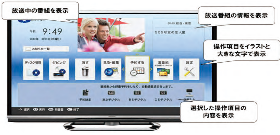
図1 ビジュアルホームメニュー