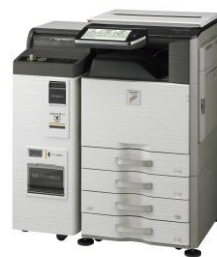
左：「ネットワークプリント for Biz」サービスイメージ、右：シャープマルチコピー機<MX-3610DS>

シャープマーケティングジャパン株式会社（本社：大阪府八尾市、代表取締役社長：中山藤一）は、新型コロナウイルス感染症拡大による在宅勤務の急速な増加に伴い、コンビニエンスストアのマルチコピー機を活用したプリント支援サービス「ネットワークプリント for Biz」を新たに導入する企業を対象に、初期登録料および基本利用料を本年9月末までの期間限定で無料とするプランの提供を、本日より開始します。期間中は、店頭でのプリント料のみでご利用いただけます。