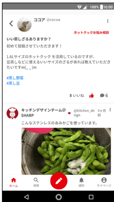
スマートフォン サイトイメージ

トーク画面では「ホットクック活用術」「ホットクックお悩み相談」「フリートーク」などお手入れから使い方までホットクックに関する全般について投稿できます。