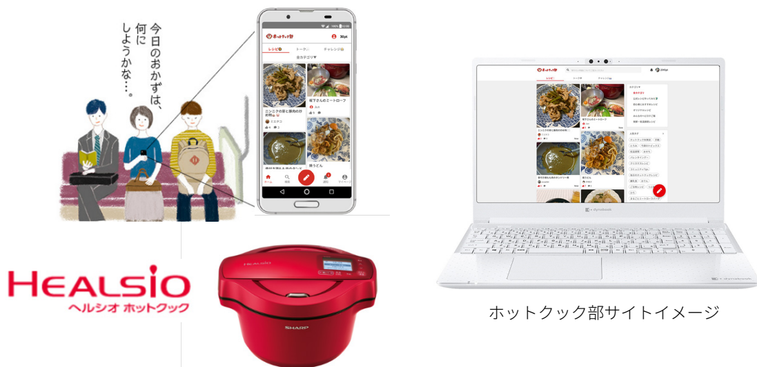
ホットクック部サイトイメージ

シャープは、“ほったらかし調理”で人気の水なし自動調理鍋「ヘルシオ ホットクック」で作ったレシピの投稿や、ユーザー同士の情報交換ができる、公式ファンコミュニティサイト「ホットクック部」をスタートします。