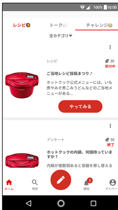
スマートフォン サイトイメージ

ホットクック部公式アカウントが募集したテーマ（「ヘビロテご飯」や「失敗談」など）について「レシピ」や「トーク」に投稿を行うことで、「ホットクック部」の楽しみ方がさらに広がります。