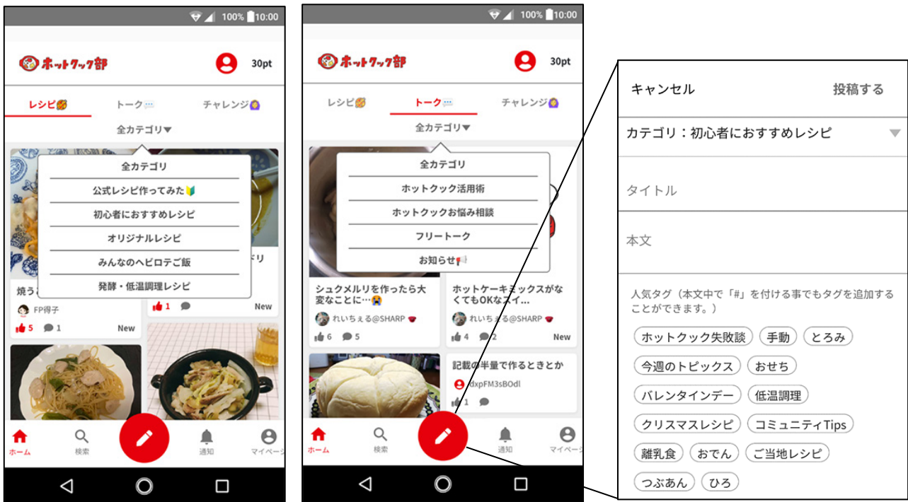
スマートフォン サイトイメージ

トップ画面中央下の投稿ボタン（鉛筆マークの赤いボタン）から、投稿先やカテゴリを選択し、タイトルと本文を入力して簡単に投稿できます。また、自分で撮影した画像や動画を添付できるほか、他の「ホットクック部」会員に気軽に意見を聞ける4択アンケートなども投稿できます。