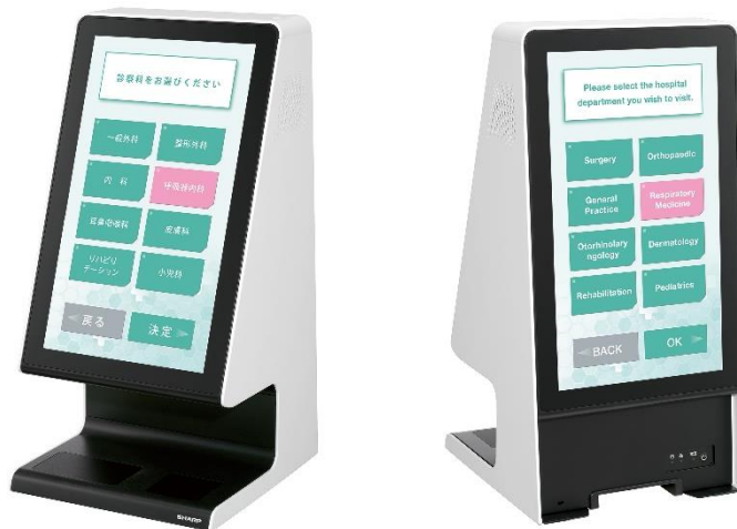
タッチターミナル<RZ-A21D>