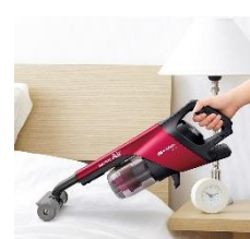
【コンパクトふとん掃除ヘッド】