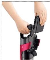
着脱式バッテリー