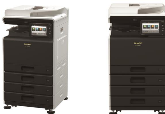
● デジタルフルカラー複合機<BP-30C25>