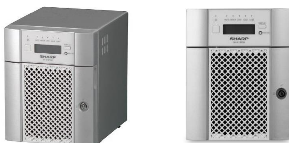
● NAS（ネットワーク接続ストレージ）〈BP-X1ST08〉

仕様表ほか本機の詳細は、以下のウェブサイトでご覧いただけます。 https://jp.sharp/business/nas/product/bp-x1st08/