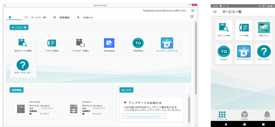
COCORO OFFICE ポータルアプリ トップ画面 (イメージ)