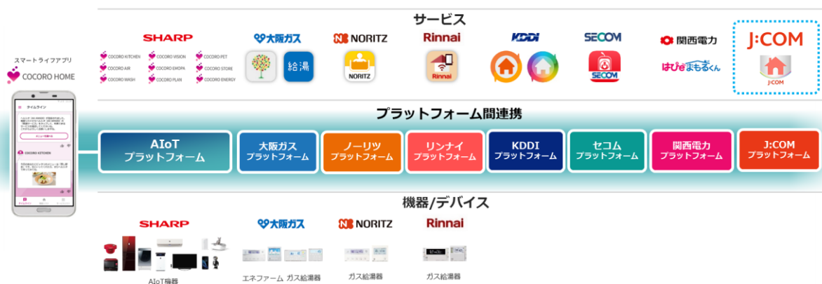
AIoTプラットフォームを活用したサービス連携のイメージ

シャープの子会社である株式会社AIoTクラウド（以下AIoTクラウド）は、独自のAIoTプラットフォームを活用し、国内最大手のケーブルテレビ会社である株式会社ジュピターテレコム（以下J:COM）とサービス契約を結んだユーザー宅で利用されているシャープ製AIoT家電（テレビ、エアコン、空気清浄機、冷蔵庫）の利用データをJ:COMに9月1日（火）より提供を開始します。これにより、J:COMのホームIoTサービス「J:COM HOME」の利用者は、「J:COM HOME」アプリでAIoT家電の稼働状況を確認できるほか、「J:COM HOME」アプリからシャープのスマートライフアプリ「COCORO HOME」を起動して、AIoT家電を操作することもできるようになりました。