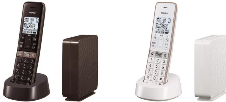
デジタルコードレス電話機 <左：JD-SF2CL-T（ブラウン系） 右：JD-SF2CL-W（ホワイト系）>

シャープは、子機の設置場所を自由に選ぶことが可能で、『アポ電』対策機能も搭載したデジタルコードレス電話機<JD-SF2CL>を発売します。