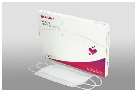
定期便のパッケージ（ふつうサイズ）