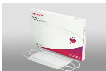
定期便のパッケージ（ふつうサイズ）

成人男性のご利用を想定した「ふつうサイズ」と、女性や小学校高学年以上のお子様向けの「小さめサイズ」の2コースを用意しました。利用者に適したサイズを利用いただくことで、マスクと顔とのフィット感が向上し、ウイルスや微粒子などの侵入抑制につながります。