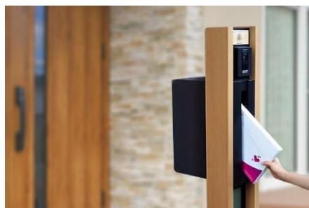
毎月自宅のポストに到着（イメージ）

シャープは、不織布マスク（ふつうサイズ／小さめサイズ）の抽選販売に加え、定期的にご購入いただける新サービス「マスク定期便サービス」のお申し込み受付を、本日開始しました。本年4月下旬以降、ECサイト「COCORO STORE」を通じた抽選販売に限定してまいりましたが、「日本製のシャープマスクを毎日利用したい」というお客様のニーズにお応えすべく、安定供給しやすい自社生産の強みを活かし、新たに「マスク定期便サービス」を開始します。お申し込み順に、12月下旬より発送いたします。