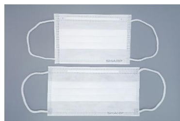
小さめサイズ（上）とふつうサイズ