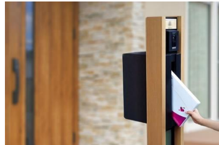
毎月自宅のポストに到着（イメージ）

シャープは、不織布マスク（ふつうサイズ／小さめサイズ）の抽選販売に加え、定期的にご購入いただける新サービス「マスク定期便サービス」のお申し込み受付を、本日開始しました。本年4月下旬以降、ECサイト「COCORO STORE」を通じた抽選販売に限定してまいりましたが、「日本製のシャープマスクを毎日利用したい」というお客様のニーズにお応えすべく、安定供給しやすい自社生産の強みを活かし、新たに「マスク定期便サービス」を開始します。お申し込み順に、12月下旬より発送いたします。