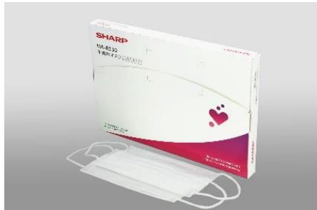
定期便のパッケージ（ふつうサイズ）