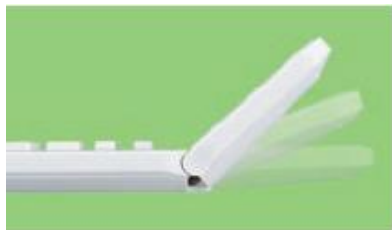
見やすい角度に調整できるチルトディスプレイ <EL-VN83/-NA92X/-SA92X>