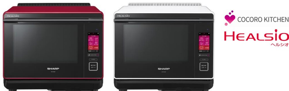
左より<AX-XA20-R (レッド系)、-W (ホワイト系)>

シャープは、手の込んだ本格的な料理を自宅でも手軽に楽しめる、食のサービスと連携したウォーターオープン「ヘルシオ」<AX-XA20>を発売します。