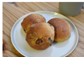
ミニレーズンパン