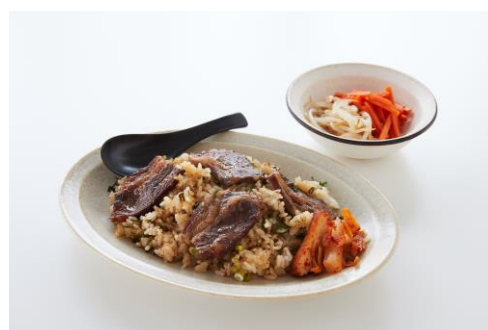
2段調理 焼肉チャーハン（上段）&たっぷり温野菜（下段） （調理目安時間 20~25分）