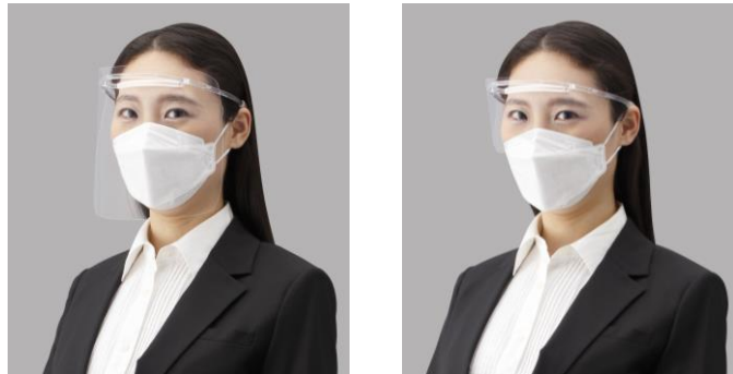
左から、フェイスシールド<FG-F20M>、アイシールド<FG-E20M>

シャープは、低反射・防曇によるクリアな視界に加え、快適な装着感で長時間の使用をサポートするポリカーボネート製フレームのフェイスシールド／アイシールド2種類2モデルを発売します。