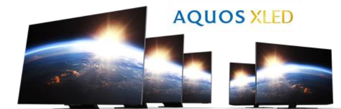
『AQUOS XLED』 DXライン（左）／ DPライン（右）

なお、コマーシャル動画は当社ウェブサイト（ https://jp.sharp/products/cm/ ）でもご覧いただけます。