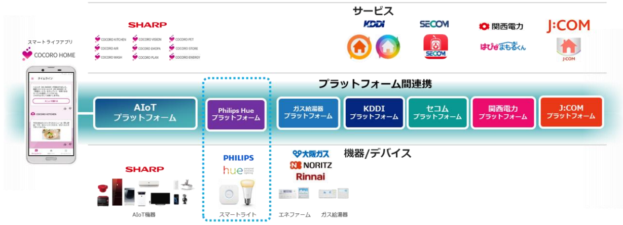
AIoTプラットフォームを活用したスマートライト連携のイメージ

シャープは、グループ会社である株式会社AloTクラウド（以下、AloTクラウド）のクラウドサービス「AIoTプラットフォーム」を活用し、他社製IoT家電として初めて、シグニファイジャパン合同会社（以下、シグニファイジャパン）のLED照明機器であるスマートライト「Philips Hue（フィリップスヒュー）」との連携を本日より開始します。